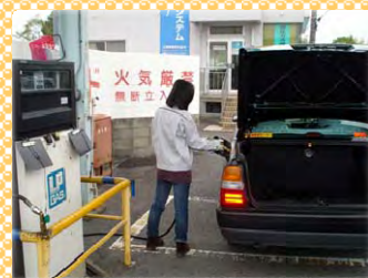
オートガススタンドでタクシーに燃料を充填。