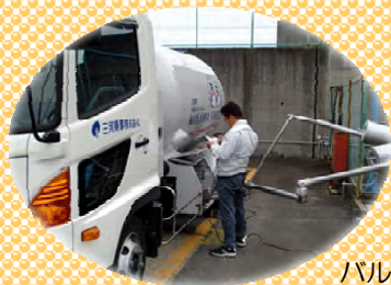
バルクローリー車へLPガスの積み込み。

供給部では、検針情報やお客様情報など常にアンテナを張り安定供給をめざしています。 また、交通事故や物損事故を起こさない様、安全運転と慎重な作業にも心掛けています。