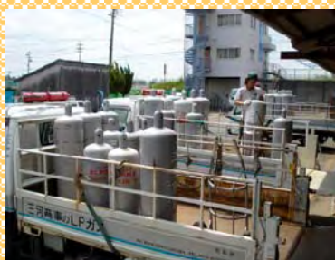
取替済みの空ボンベを降ろし、充填済みボンベを積み込んでいます。