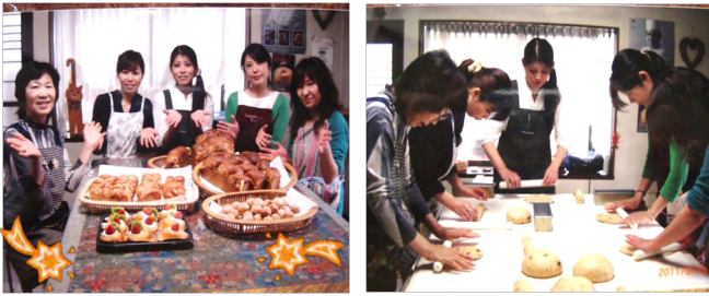
完成(*^_^*) 美味しそう★ ♪無添加でおいしいパン作り♪