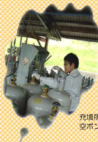
充填所内の様子。空ボンベに充填中。