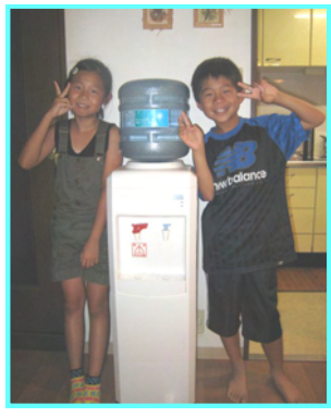
<サーバーと一緒に、はいピース!!>

カリメラの水 は、富士山麓から湧き出る弱アルカリ性の天然水です。軟水なので口当たりがまろやかで美味しく、体にも吸収されやすいので、夏場の水分補給にはピッタリです!!