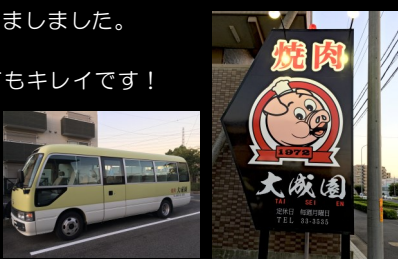
道路沿いにある豚の看板が目印です♪

毎週金曜日はとってもお得★ ・生ビール(中) 250円 ・焼酎ボトル 半額 ※17時~閉店までとなります