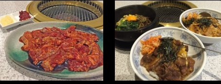
↑カルビ 600円～ ↑丼 650円～

豊田市朝日ヶ丘の焼肉大成園さんにおじゃましました。今年で20周年を迎えたお店です。6月に店内をリニューアルされたばかりでとてもキレイです! 広々とした掘りごたつ席や個室があり、宴会からファミリーまで楽しく過ごせます♪