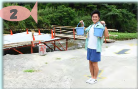
鮎が流れてくるよ